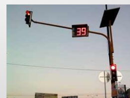
Lampu Lalu Lintas