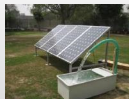
Pompa Air Tenaga Surya