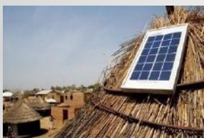
Solar Home System